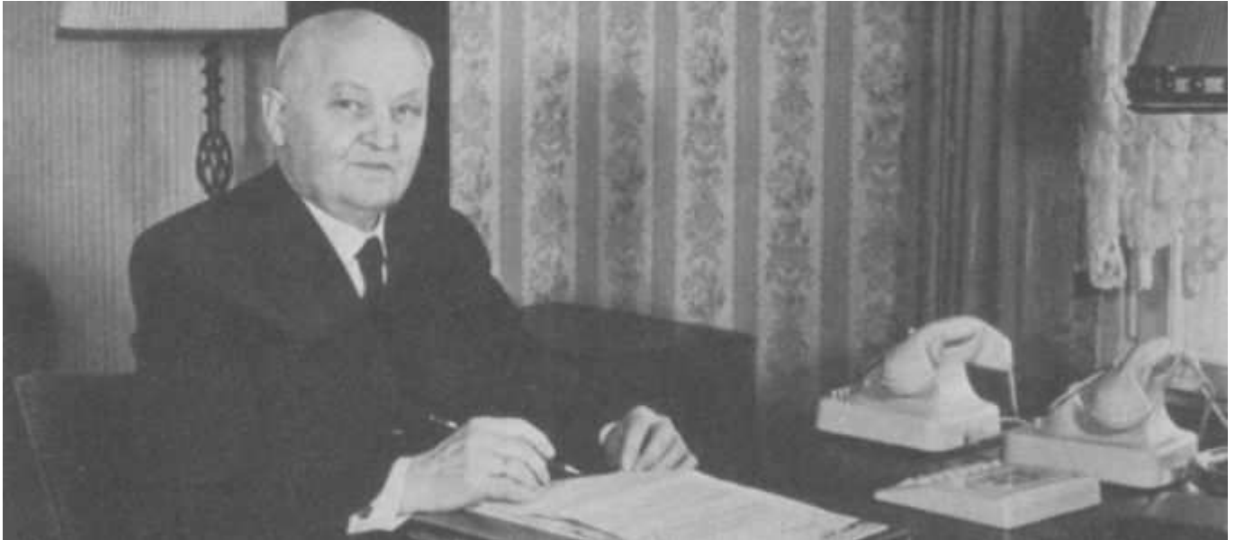
1960: Am Schreibtisch in Dortmund, Foto: Zentralarchiv NAK NRW

Er führte die Neuapostolische Kirche aus der Krise des Glaubens und noch ein gutes Stück weiter: Stammapostel Walter Schmidt, der heute (21.12.) vor 125 Jahren geboren wurde. Wie hat er den Ausnahmezustand gemeistert? – Eine Annäherung.