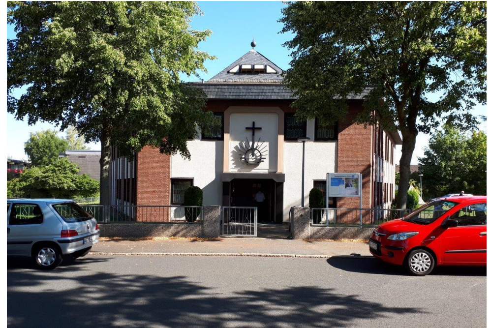
Unsere Kirche in Goslar – hier dient der Stammapostel zu Pfingsten

Gemeindebrief der Neupostolischen Kirche, Gemeinde Luckenwalde Ausgabe Juni 2019