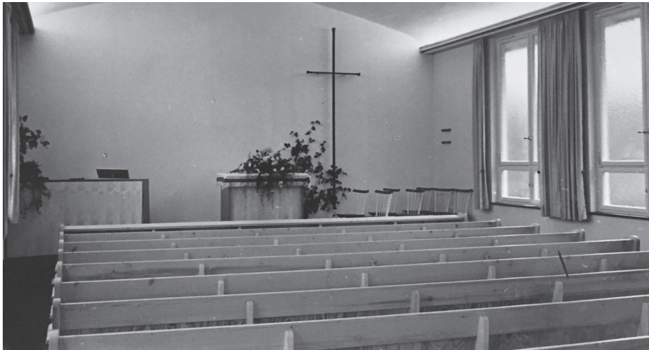
Der Sakralraum der Kirche 1959