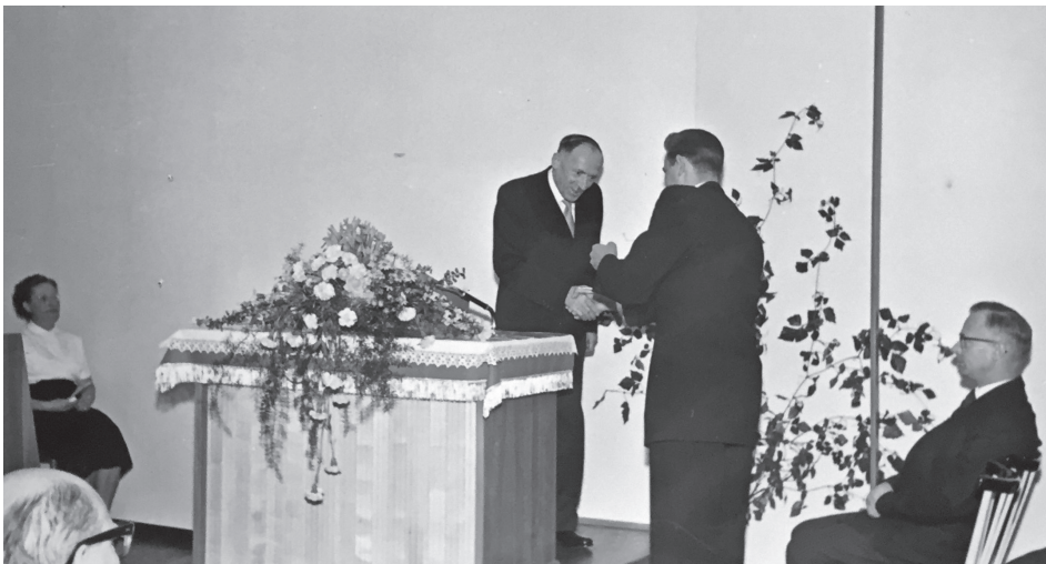
Weihegottesdienst am 13. Juni 1959

1959 hatte die Gemeinde 90 Mitglieder und erhielt im gleichen Jahr eine eigene Kirche, in der Bergstraße 35/1 in Esslingen-Sulzgries. Nach nur 7½-monatiger Bauzeit wurde die Kirche, die bis zu 180 Personen fassen kann, in einem Festgottesdienst mit Bischof Ernst Holder am 13. Juli 1959 geweiht.