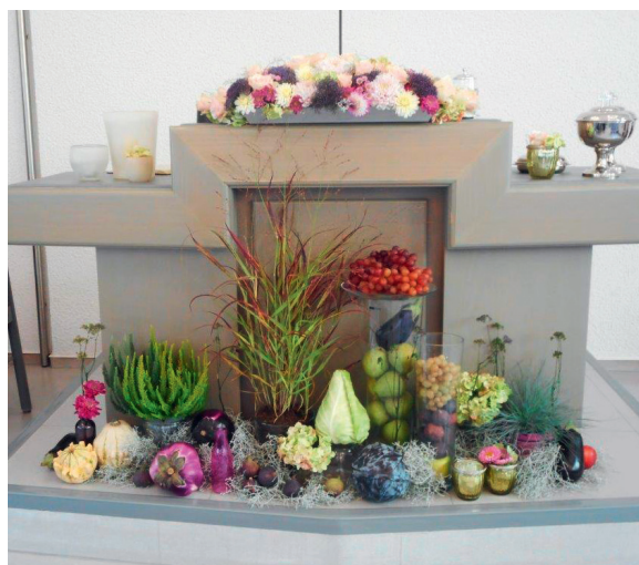
Der zum Jubiläums-Dank-Gottesdienst am 3. Oktober 2021 geschmückte Altar

Im Herbst des Jahres 2021, am Sonntag, 3. Oktober, besuchte Apostel Jürgen Loy die Gemeinde und feierte mit ihr Gottesdienst. Eine Livestream-Übertragung des Gottesdienstes gab es in die benachbarte Gemeinde Esslingen-Waldenbronn.