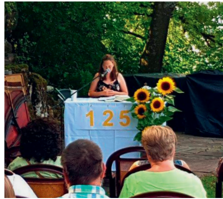
Lesung der Kurzchronik