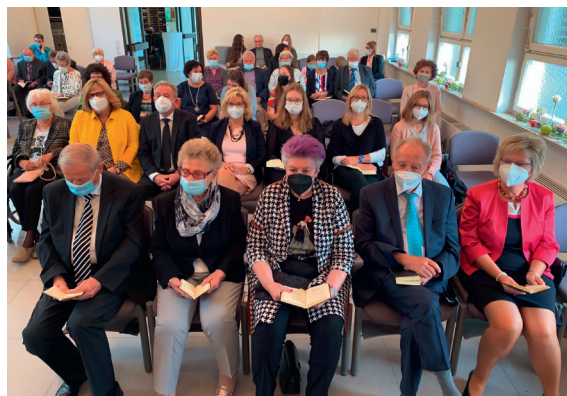
Gemeinde im Gottesdienst 2021 (Platzierung gemäß COVID-19-Infektionsschutzkonzept)

Zu erwähnen ist das »Singen und Musizieren im Katharinenstift«, einem Alten- und Pflegeheim, das seit über zwei Jahrzehnten jährlich stattfindet (soweit dies während der COVID-19-Pandemie möglich ist) und Zuhörern und Musizierenden viel Freude macht. Nicht zu vergessen aber auch der »Sulzgrieser Herbst«, bei dem dank der »Feldküche« der Gemeinde das leibliche Wohl nicht zu kurz kommt.