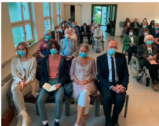
Blick in die Gemeinde (unter COVID-19-Bedingungen)

Für die Jugendlichen gibt es spezielle Angebote der Seelsorge und der Freizeitgestaltung, wie Jugendabende, Jugendgottes-