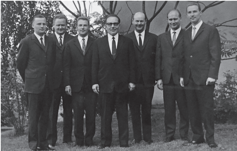
Die Amtsträger im Jahr 1959

Eine Umgestaltung und Modernisierung der Kirche in der Bergstraße 35/I erfolgte im Jahr 1971. In einem Gottesdienst mit Bischof Ernst Sikeler wurde sie am 25. Juli 1971 wieder ihrer Bestimmung übergeben.