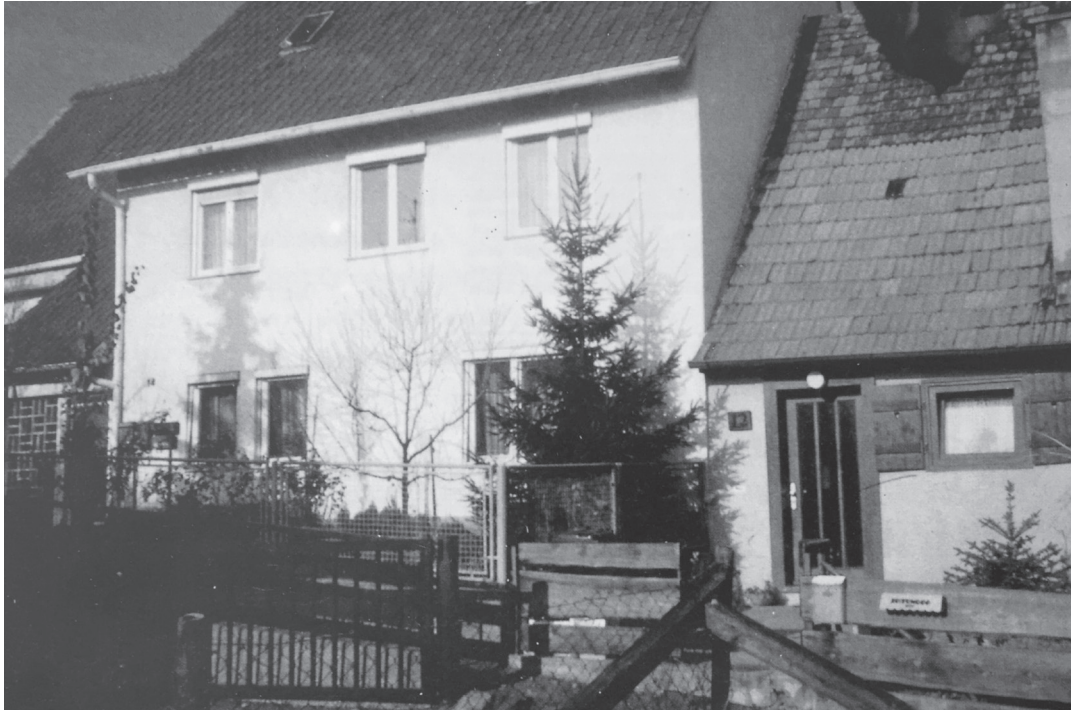
Die erste Versammlungsstätte in der Hohenackerstraße 14

erfolgte die seelsorgerischen Betreuung der Sulzgrieser Gemeindemitglieder von Stuttgart aus.