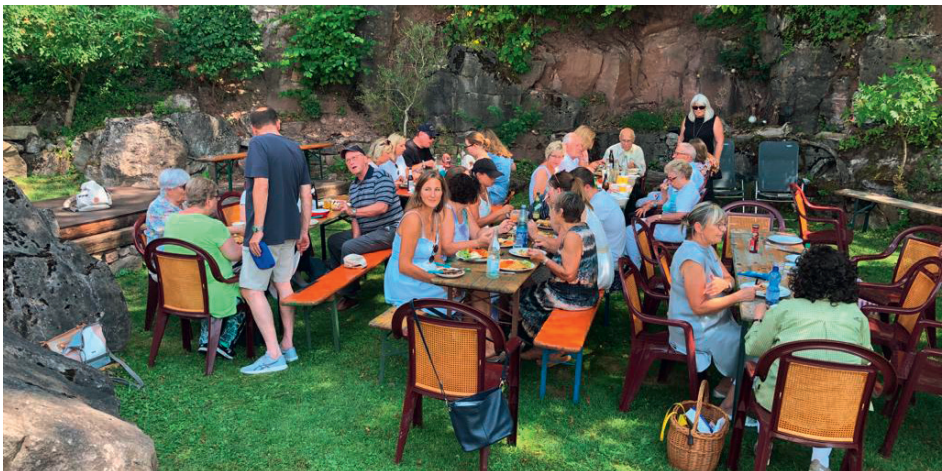
Grillfest nach dem Open-Air-Gottesdienst mit den »Ehemaligen«