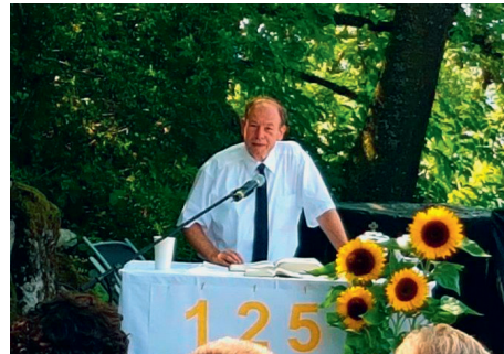
Stellvertretender Gemeindevorsteher Wahl