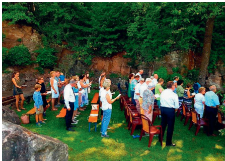
Open-Air-Gottesdienst am 24. Juli 2022 ...