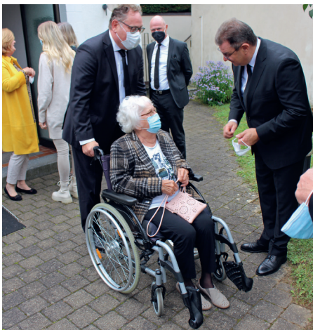
Verabschiedung nach dem Jubiläumsgottesdienst am 3. Oktober 2021

Der Apostel bestärkte die dankbaren Herzensregungen der Glaubensgeschwister über viel Gotterleben, des Herrn Beistand und seinen Segen im Geistlichen. Da an diesem ersten Sonntag im Oktober auch das Erntedankfest gefeiert wurde, herrschte große Dankbarkeit auch für Gottes Segen im Irdischen. In seinen Ausführungen verband der Apostel die beiden Festtage mit der Aufforderung zur Dankbarkeit in allen Dingen.