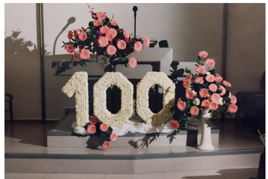
Für den Festgottesdienst zum 100-jährigen Jubiläum geschmückte Altar

Im Herbst 1996 beging die Gemeinde ihr 100-jähriges Bestehen. Den Auftakt des Jubiläums, über das auch in der Zeitschrift »Unsere Familie« Nr. 24/1996 berichtet wurde, bildete eine Feierstunde, in der an die Anfänge und die Ausbreitung der Neuapostolischen Kirche von Sulzgries aus in der Region Esslingen gedacht wurde. Zur Freude der Glaubensgeschwister kam zu dieser Feier-