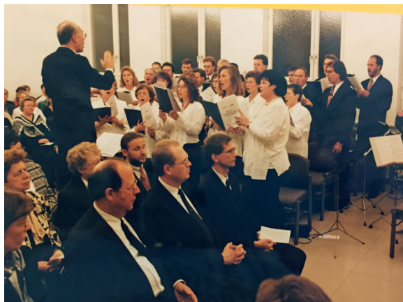
November 1996, Festgottesdienst zum 100-jährigen Bestehen der Gemeinde

Den Abschluss der Jubiläumsfeierlichkeiten zum 100-jährigen bildete ein Festkonzert am 24. November 1996 in der Esslinger Stadthalle. Unter den annähernd 1000 Besuchern war der Esslinger Oberbürgermeister, der ein Grußwort sprach.