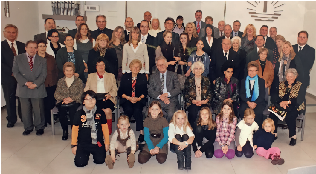
Die Gemeindemitglieder im Jahr 2011

Um die Kinder und Heranwachsenden zum Handeln nach den Grundwerten des Evangeliums hinzuführen, wird Konfirmandenunterricht und Religionsunterricht durchgeführt, zurzeit gemeindeübergreifend in der Gemeinde Esslingen-Mitte. Die Grundschüler sind dorthin in die Sonntagsschule eingeladen,