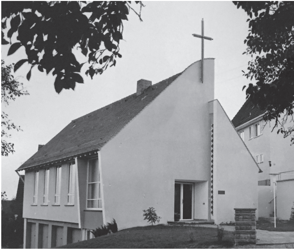
Die 1959 geweihte Kirche in der Bergstraße 35/1