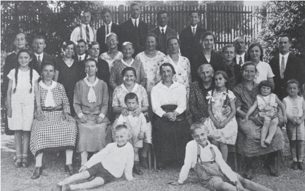
Die Sulzgrieser Glaubensgeschwister im Jahr 1931